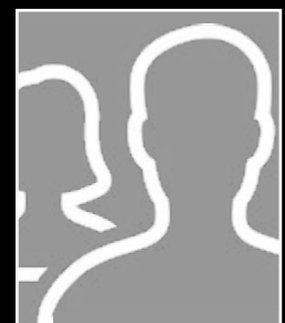
Familieafdelingens Frontteam Tlf. 8787 7640