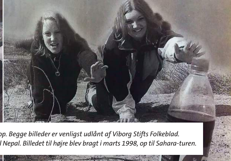
Rejserne til de mere utraditionelle dele af verden blevet slået stort op. Begge billeder er venligst udlånt af Viborg Stifts Folkeblad. Billedet til venstre blev bragt i oktober 1997, da en flok unge rejste til Nepal. Billedet til højre blev bragt i marts 1998, op til Sahara-turen.