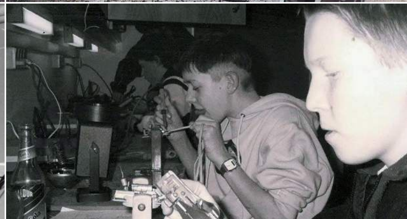
Der var gang i Ungdomsskolens fritidshold i 1990'erne - men det var ikke ønskværdigt med alt for populære hold. Kom man over 25 tilmeldte, skulle man oprette et ekstra - og selv finansiere det. Det blev der ændret på med rammestyringen. Begge fotos er fra egne arkiver.